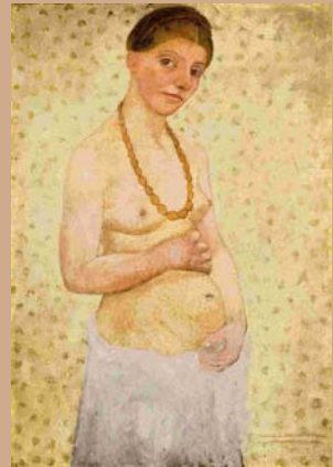
Paula Modersohn-Becker: Selbstbildnis am 6. Hochzeitstag, 1906, Kunstsammlungen Böttcherstraße, Paula Modersohn-Becker Museum, Bremen.

Öffnungszeiten: Himmelfahrt 13 - 18 Uhr, Dienstag - Sonntag 11 - 18 Uhr